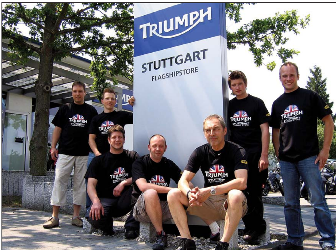
So sehen Sieger aus: Das Team von TRIUMPH Stuttgart

Der ADAC hat gemeinsam mit der Zeitschrift „Motorrad“ 32 Motorrad-Werkstätten getestet. Mit einem grandiosen Ergebnis für TRIUMPH: Der beste Betrieb war TRIUMPH Stuttgart mit voller Punktzahl. Alle vier TRIUMPH-Werkstätten zusammen schaffen 314 Punkte und belegen nur ein Pünktchen hinter dem Primus den zweiten Gesamtrang.